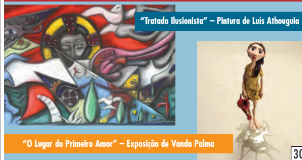
“Tratado Ilusionista” – Pintura de Luis Atoughia